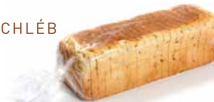
K ROZMRAŽENÍ A PODÁVÁNÍ

Vícezrnný pšeničný chléb s obohacený slunečnicovými, lněnými a sezamovými semínky. Předkrájený na 20 plátků (cca 9,5x9,5x1,2 cm) + 2 patičky. Po rozmražení skladujte maximálně po dobu 3 dnů (při pokojové teplotě a v obalu uzavřeném klipem).