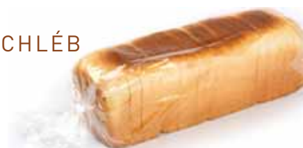
K ROZMRAŽENÍ A PODÁVÁNÍ

Světlý pšeničný chléb předkrájený na 20 plátků (cca 9,5x9,5x1,2 cm) + 2 patičky. Po rozmražení skladujte maximálně po dobu 3 dnů (při pokojové teplotě a v obalu uzavřeném klipem).