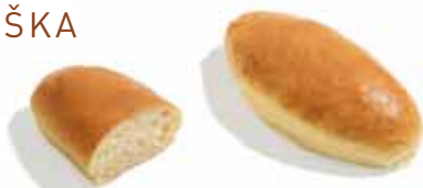
K ROZMRAŽENÍ A PODÁVÁNÍ

Typická belgická bulka z měkkého a krásně nadýchaného brioškového těsta. Pro ještě lepší chuť je obohacená máslem a vejci.